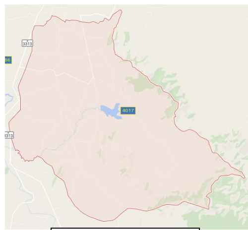
ตำบลหนองพันจันทร์